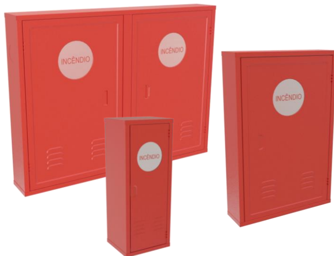
TABELA DE ESPECIFICAÇÕES